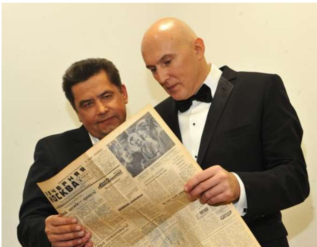
1961 — Константин Львович Эрнст, продюсер, телеведущий.